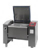
JUMP 101 ▾ JUMP 101 F ▾