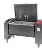
JUMP 151 P ▾ JUMP 151 FP ▾