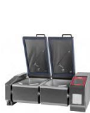
JUMP 101 DS ▾