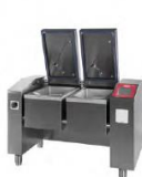
JUMP 101 D ▾