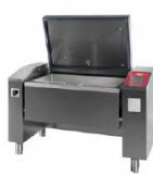
JUMP 151 ▾ JUMP 151 F ▾