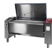
JUMP 201 ▾ JUMP 201 F ▾ JUMP 251