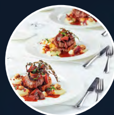
BANQUETING AND EVENTS