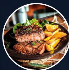
STEAKHOUSE & BRASSERIE