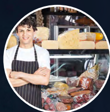
GDO, DELI & GOURMET SHOPS